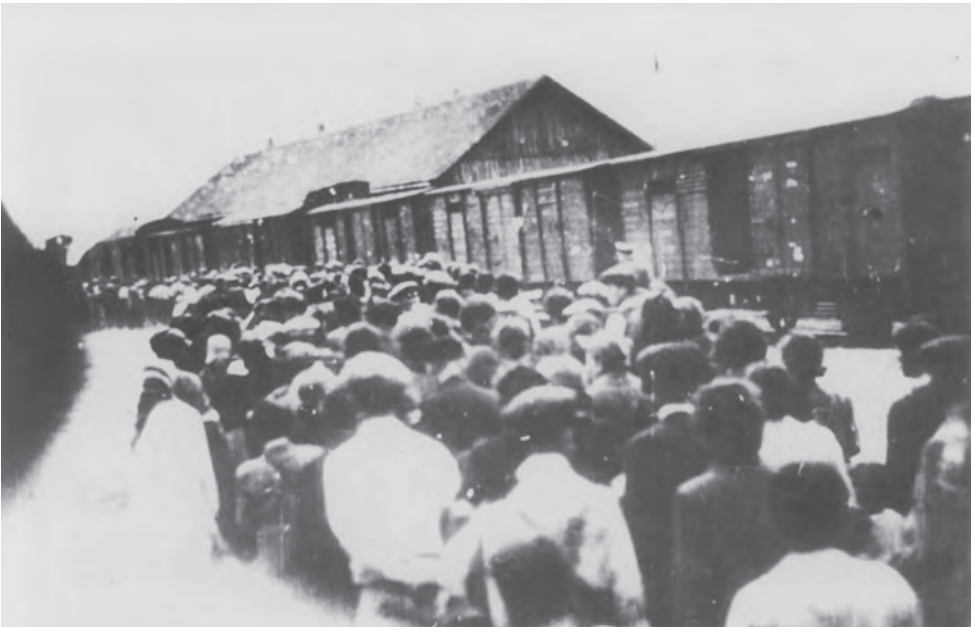
Депортація з Коломиї. Вересень 1942 р. Фотографії зроблені з укриття, імовірно-ше, членом польського руху опору. Меморіальний музей у Белжеці (Muzeum-Miejsce Pamięci w Bełżcu)