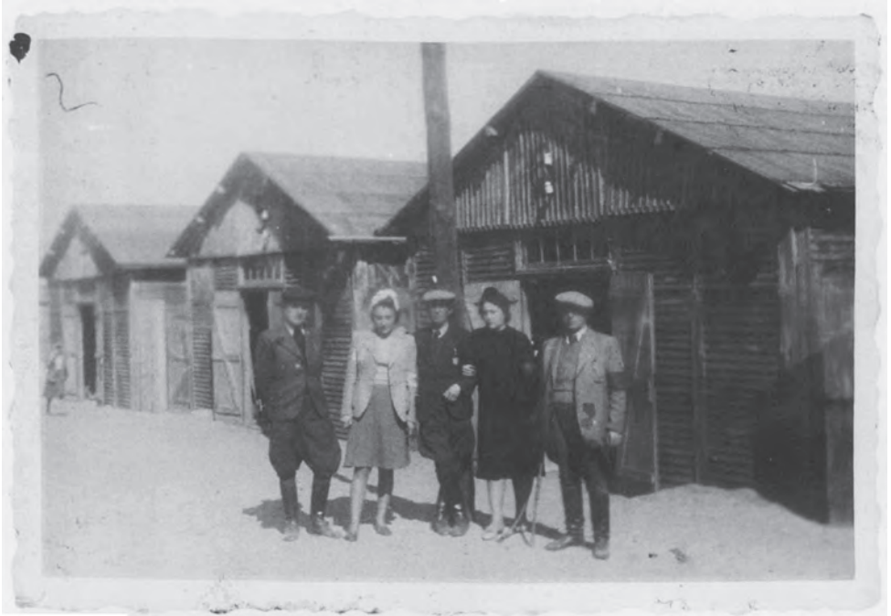
Єврейські в'язні з Табору I в осередку смерті у Белжеці. Регіональний музей у Томашеві-Любельському ( Muzeum Regionalne w Tomaszowie Lubelskim )